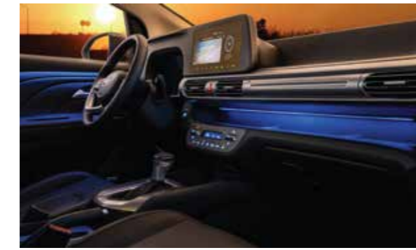
Đèn viền nội thất giúp trang trí và giúp định hướng vị trí vào buổi tối