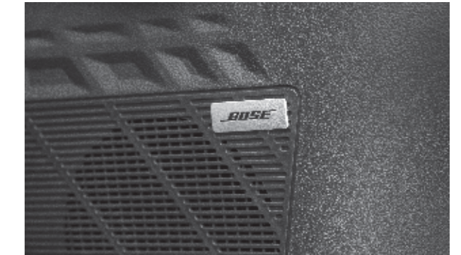
Hệ thống 8 loa Bose cho trải nghiệm âm thanh sống động ở phiên bản cao cấp