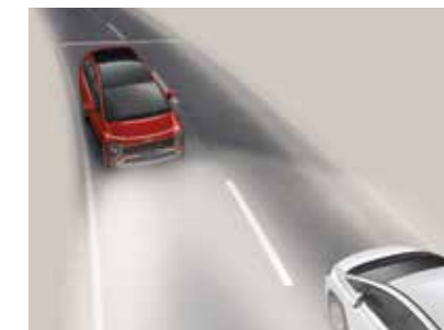
Đèn pha thông minh tự động bật tắt