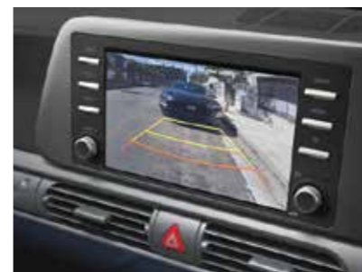
Camera lùi góc rộng hỗ trợ đỗ xe