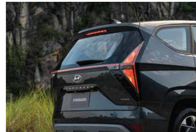
Cụm đèn hậu dạng chữ H dễ nhận diện ở tất cả các phiên bản

Các đường cong mềm mại tạo ra các mảng tách biệt toát lên hình ảnh thể thao.