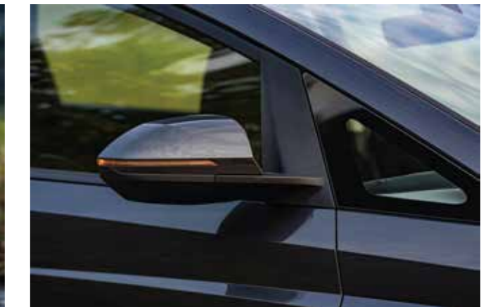
Xi nhan tích hợp trên gương tiện lợi