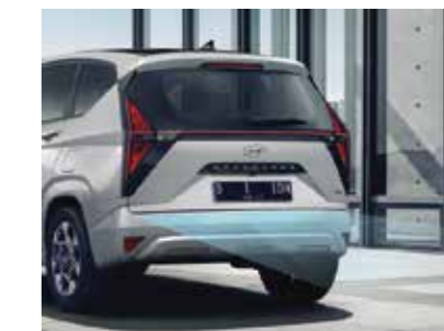
Cảm biến lùi hỗ trợ đỗ xe