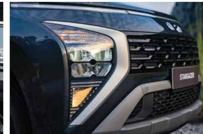
Đèn chiếu sáng LED (Phiên bản cao cấp/cao cấp 6 chỗ)