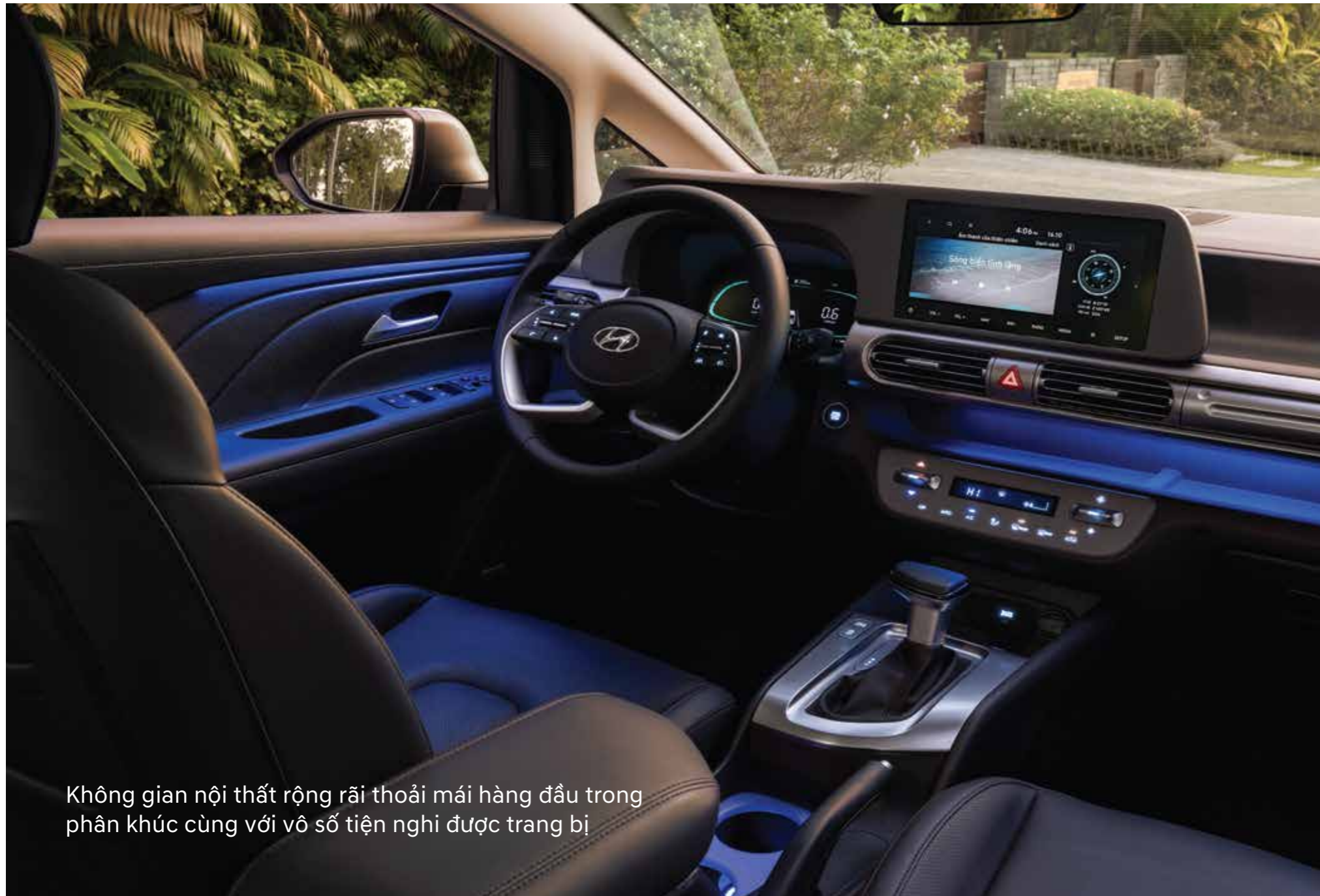
Không gian nội thất rộng rãi thoải mái hàng đầu trong phân khúc cùng với vô số tiện nghi được trang bị