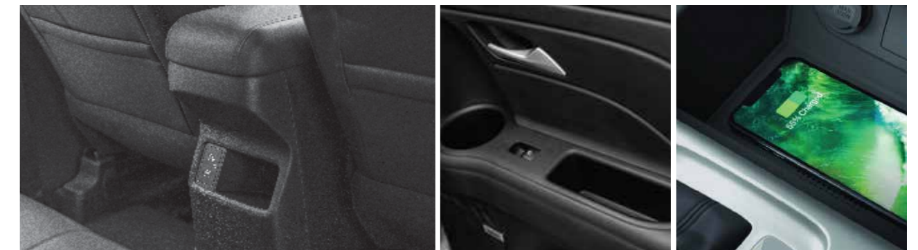
Cổng sạc và khay đựng đồ được bố trí ở tất cả vị trí ngồi