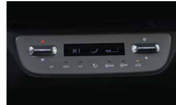
Điều hoà tự động với nút bấm cảm ứng và lẫy gạt trên phiên bản cao cấp giúp cho chiếc xe được tăng thêm tính tiện nghi