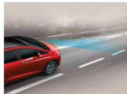
Hỗ trợ giữ làn đường

Hộp số CVT cải tiến cho hiệu quả tiết kiệm nhiên liệu +4.2% và dải tay số rộng hơn so với hộp số tự động 6 cấp đem đến trải nghiệm vận hành êm ái, độ ổn và rung động thấp hơn