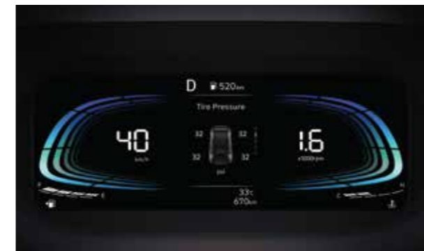
Cảm biến áp suất lốp có khả năng hiển thị giá trị áp suất của từng lốp