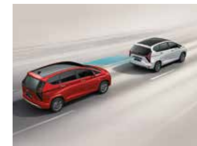
Cảnh báo phòng tránh va chạm phía trước