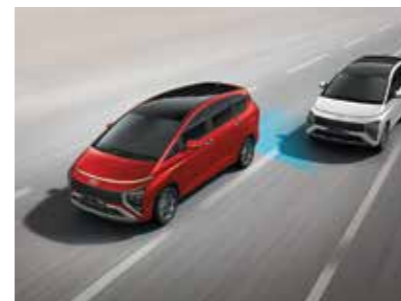
Cảnh báo điểm mù và phòng tránh va chạm