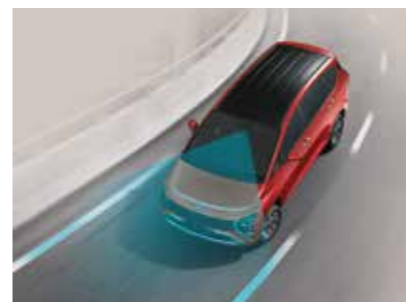
Cảnh báo lệch làn đường