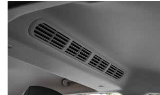
Cửa gió điều hoà hàng ghế sau được trang bị cùng với 4 hốc gió và 3 cấp độ của quạt gió giúp làm mát nhanh và sâu hơn