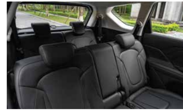
Không gian nội thất rộng hàng đầu phân khúc