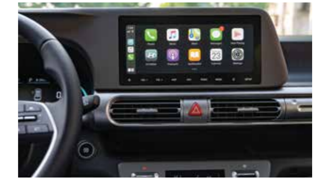
Kết nối Apple Carplay / Android Auto không dây