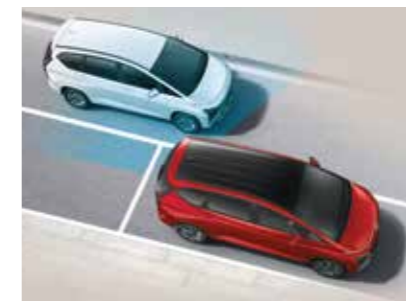
Cảnh báo mở cửa xe khi dừng đỗ