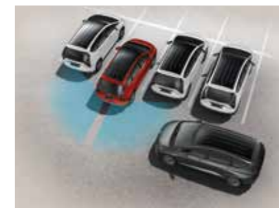
Cảnh báo và phòng tránh va chạm phía sau